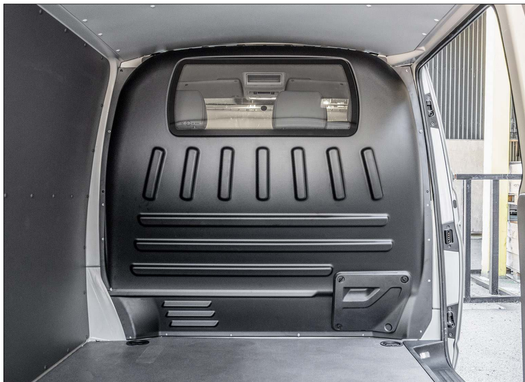
Komfortvägg i formad ABS-plast med genomsiktsruta i polycarbonat