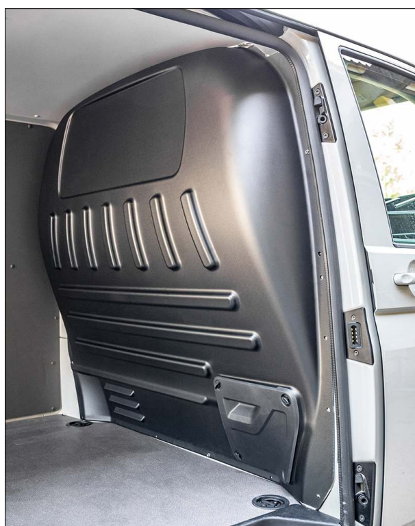
Komfortvägg utan ruta